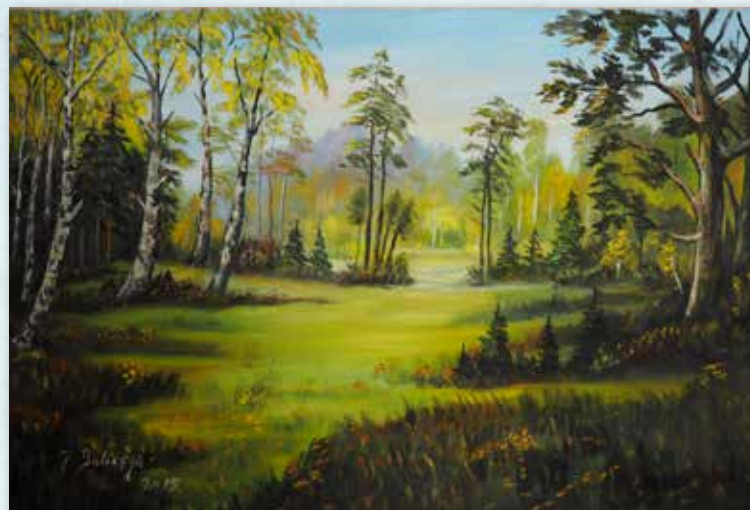
Park brzozowy , olej na płótnie, 40x60cm, 2015.

Urodził się w roku 1938 w Podobinie, w gminie Niedźwiedź, w starej rodzinie góralskiej. Mieszka w Radziszowie. Pierwszą jego pasją jest muzyka – gra na harmonii i skrzypcach. Od 1980 roku gra w Kapeli Ludowej z Radziszowa, zdobywając nagrody i wyróżnienia za kultywowanie tradycji ludowych. Druga pasja to malowanie. Jest samoukiem, maluje od 1958 roku – pejzaże tatrzańskie, scenki z życia wsi, stare domy, młyny, drewniane kościoły, pędzące konie – wszystko to, co przemija i odchodzi w niepamięć. Brał udział w konkursach regionalnych i ogólnopolskich, kiermaszach, przeglądach i festiwalach. Miał wiele wystaw indywidualnych, z których najważniejsze to wystawy w Lipsku, Bratysławie, Sztokholmie oraz biennale w Skawinie. Jest najbardziej znaną postacią w Radziszowie i ambasadorem kultury ludowej swojego terenu.