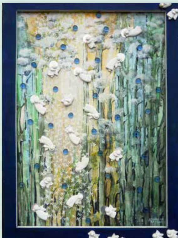
Aniolki zimy , collage, 70x50 cm, 2015.

Rodowita chrzanowianka, już od dzieciństwa wykazywała zainteresowania sztuką – by rozwijać zainteresowania wybrała Liceum Plastyczne w Nowym Wiśniczu. Nabyte umiejętności wykorzystuje w pracy zawodowej i twórczości płynącej z głosu serca. Pracowała jako malarska tkanin jedwabnych w Milanówku, jako plastyk, prowadziła studio reklamy, a także przy renowacji obiektów zabytkowych w całej Polsce, od Malborka po Przemyśl. Jest członkiem stowarzyszeń artystycznych, bierze czynny udział w plenerach i warsztatach artystycznych oraz wystawach zbiorowych. Miała kilka wystaw indywidualnych. Wystawia ceramikę i oryginalne kolaże łączące płaskorzeźbę i malarstwo.